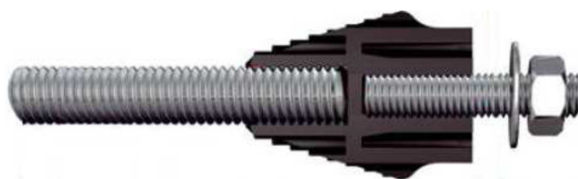
Beispiel Fischer Thermax für schwere Lasten