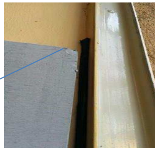
Fugenband gegen Fensterrahmen

Eckschutzleiste aus Kunststoff 2,6 m (abgelängt auf 1,3 m). Zur Verstärkung der Kanten