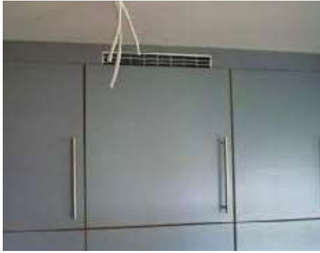
Lüftungsgitter im Oberschrank