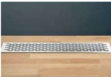
Lüftungsgitter in der Arbeitsplatte