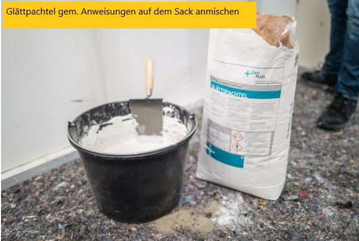
Glättpachtel gem. Anweisungen auf dem Sack anmischen