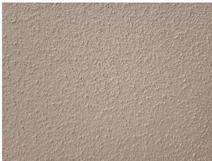
Streichputz Fotomuster ohne Gewähr

Diese Fotostory ersetzt nicht die bebilderte Einbauanleitung. Bei weiteren Fragen wenden Sie sich bitte an unsere Hotline.